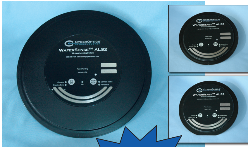
上: WaferSense ALS2300C 右上 Inset top: ALS2200C 右下 Inset bottom: ALS2200CF